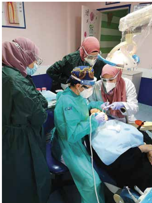
Libano - Formazione COI in ambulatorio