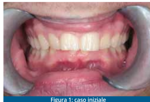
Figura 1: caso iniziale