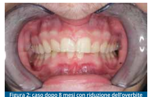
Figura 2: caso dopo 8 mesi con riduzione dell'overbite